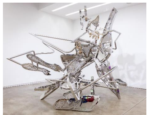
松山智一 《Dancer》2022 H339 x W360 x D359 cm Stainless Steel