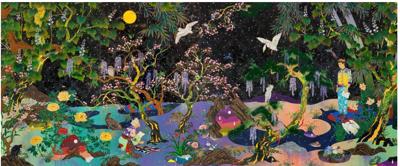
松山智一 《We Met Thru Match.com》2016 H254 x W610cm Acrylic and mixed media on canvas

ニューヨークでキャリアをスタートした松山にとってクリエイティブ・コミュニティとの接点は日常であり、様々なジャンルの表現者との交流のなかで表現領域を拡張してきました。日常性と社会性をアートの文脈でどう捉え、表現できるかを常に模索してきた松山は、同時代を生きる彼/彼女らとの自然発生的に生まれる対話が時代の声になると考えます。本展の地下1階の麻布台ヒルズ ギャラリースペースでは、松山と共鳴する表現者との共作の数々を発表します。