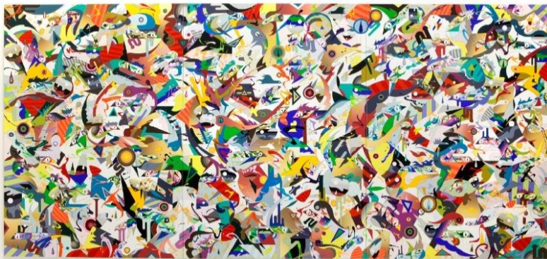
松山智一 《Keep Fishin' For Twilight》2017 H213.5 x W457.5 cm Acrylic and mixed media on canvas